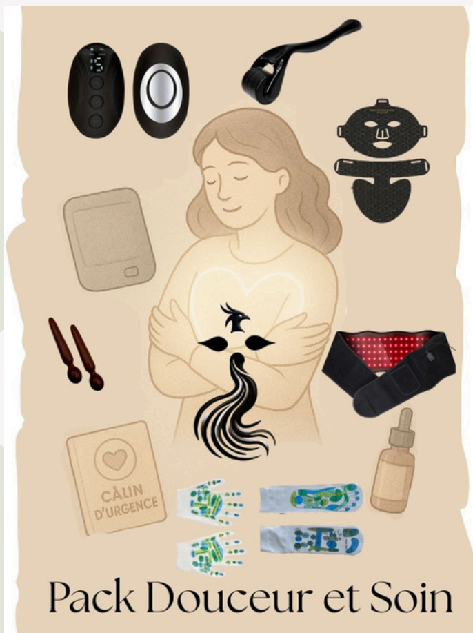
Pack Douceur et Soins